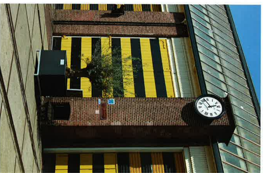
De Rijtuigenloods, Amersfoort

Het eerste Nationaal Monumenten Congres vindt plaats in de Rijtuigenloods te Amersfoort op donderdag 8 november. Het thema is: 'Verzilveren van identiteit, over monumenten en economie'.